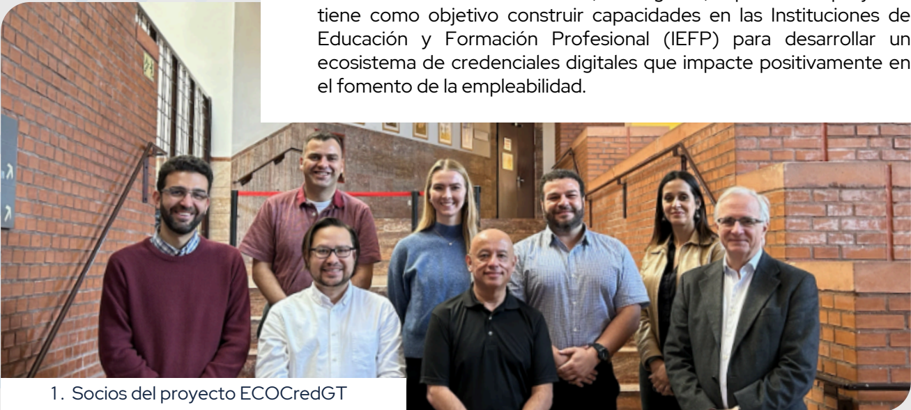
1. Socios del proyecto ECOCredGT

Los días 15 y 16 de febrero de 2024 se llevaron a cabo las primeras reuniones del consorcio ECOCredGT en las instalaciones de la Universidad Carlos III de Madrid, en Leganés, España. Este proyecto tiene como objetivo construir capacidades en las Instituciones de Educación y Formación Profesional (IEFP) para desarrollar un ecosistema de credenciales digitales que impacte positivamente en el fomento de la empleabilidad.